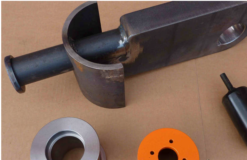
Figure 2: Traversenkomponenten aus eigener Fertigung

Mechanische Teile sind meist nicht direkt ab Lager verfügbar, können aber auf Anfrage hergestellt werden. Unsere hohe Fertigungstiefe ermöglicht es uns, eine Vielzahl von mechanischen Komponenten in kürzester Zeit zu produzieren.