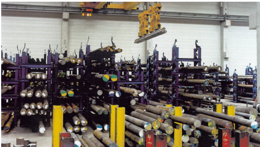
Figure 1: Ansicht eines typischen Stapeljochlagers

Mit einem Stapeljochsystem lassen sich große Materialmengen auf engstem Raum lagern. Das Lagersystem ist die flexible Lösung für eine platz sparende, sichere Lagerung von Lang- und Flächenmaterial sowie Produkte mit großem Volumen.