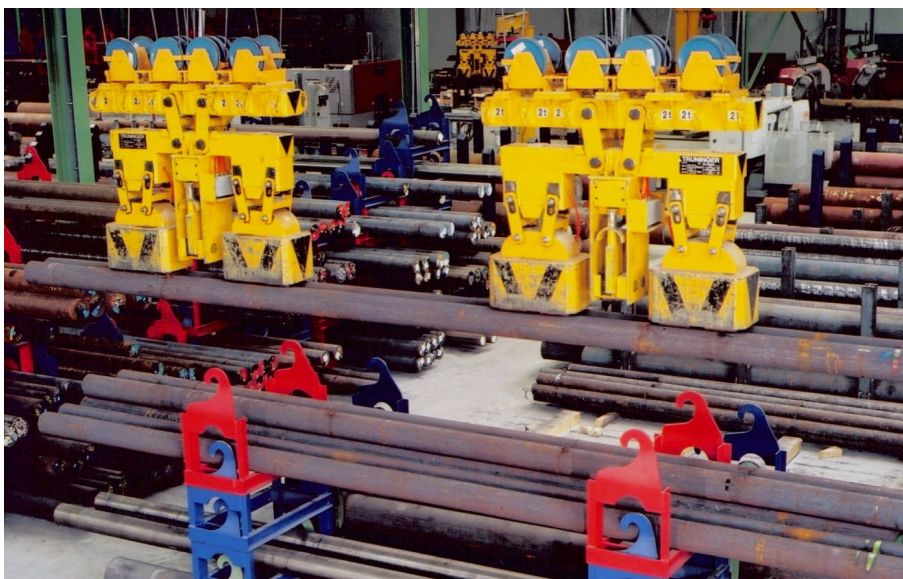
Figure 3: Magnetisches Kommissionieren aus den Stapeljochen

Beim magnetischen Kommissionieren werden die Stapeljochträger-Zapfen wiederum motorisch eingeklappt. Die Stapeljochträger sind nicht breiter als die Magnete. Damit ist ein ungehindertes Kommissionieren des Langgutes gewährleistet.