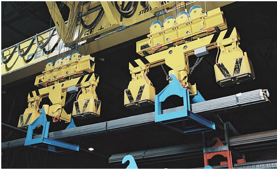
Figure 4: Jochträgertransport mit drehbaren Jochträgern

Bei breiten Lasten oder bei Flächenlasten muss aus statischen Gründen eine andere Jochträgerkonstruktion vorgesehen werden. Die Jochträgerzapfen werden nicht mehr ausgeklappt, sondern der ganze Jochträger wird motorisch gedreht.